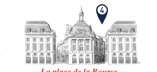
La place de la Bourse

Elle doit son nom aux arbres plantés à l'origine en quinconces le long des façades. La place fut aménagée au XIX e siècle sur l'emplacement du Château Trompette, édifié par Charles VII à l'issue de la Guerre de Cent ans. Cette forteresse avait pour but de défendre l'accès maritime de la ville, mais aussi de contrôler les bordelais fidèles à l'Angleterre, combattants aux côtés des armées anglaises pendant le conflit.