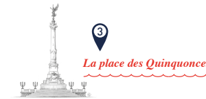
La place des Quinconces

Plus haut pont levant d'Europe, le pont Jacques Chaban-Delmas fonctionne comme un monte-charge. Cette impressionnante manœuvre est effectuée en seulement 11 mn et permet le passage des bateaux à voile et des grands paquebots de croisière maritime.